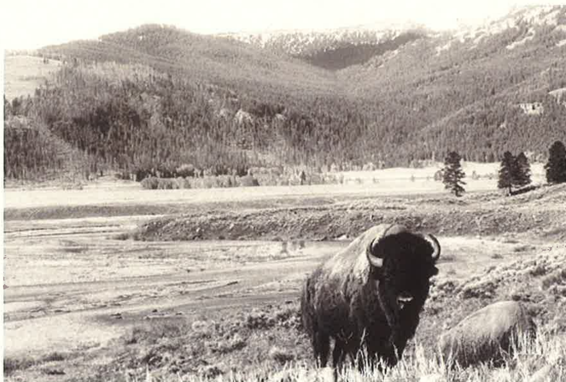
イエローストーン国立公園

主催：世界遺産地域国際連携事業実行委員会 (斜里町・羅臼町・知床財団・知床ユネスコ協会) 環境省釧路自然環境事務所