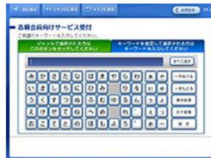
「さ」行から「知床財団」を検索

④ 「 継続申込 」をタッチ、「個人年会員」を選択後、「 会員番号 (8桁) 」と「 パスワード (4桁) 」を入力してお申込みを開始！ (パスワードは、ご登録誕生日の4桁になります。例：5月1日 → 0501)